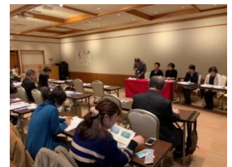
昨年の勉強会の様子

令和2年度のむくろじの会の総会/10周年記念祝賀会/懇親会を4月11日(土)に松本市の浅間温泉「みやま荘」で開催いたします。新型コロナウイルスの感染拡大により各地で店頭からマスクが無くなったり、催しの自粛がおきたりしておりますが、当会は予定通り開催する予定にしております。